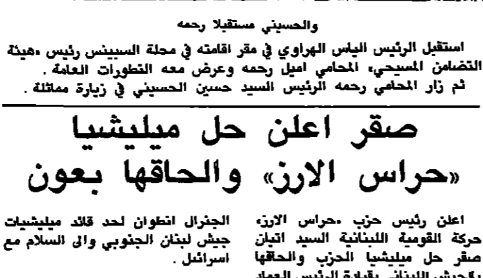
والسيدة مستقبلا رحمة

عند الخامسة والنصف استقبلت السيدة منى الهراوي عائلات اعضاء الوفد البريطاني في زيارة برتوكولية. وعند السادسة والنصف استقبل الرئيس السيد الهراوي الوفد البريطاني وعرض معه التطورات الراهنة على السلطة اللبنانية. وما يمكن لبريطانيا ان تساعده به سياسيا لمنع عجلة السلام في لبنان الى الامام واستمر الاجتماع لغاية الساعة والنصف قال بعده النائب ادلي: ان الرئيس الهراوي في مركز صعب وحساس ويحتاج ان دعم كل من فيه بلده لكي يحقق اهدافه. □ وعن هدف زيارة الوفد الى لبنان قال: جئنا لتؤكد دعماً للحكومة اللبنانية والرئيس الهراوي وللإطلاع على الوضع عن قرب ونفهم هذا الوضع. □ وسئل عن رايه بالوضع في لبنان فقال: اعتقد ان اتفاق الطائف يشكل مخرجا مهما ويجب ان تتضافر الجهود ويعتبرون الجميع والعمل من خلال اتفاق الطائف لتحقيق السلام في لبنان.